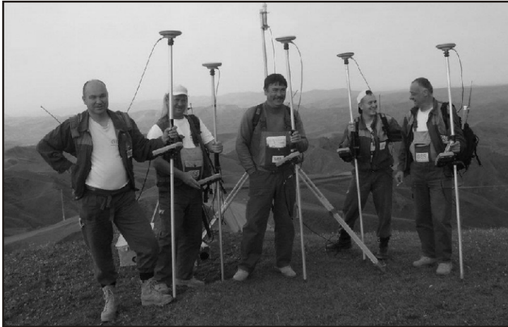
Robi jobbról a második

Észak-Irakban, Kurdisztánban. Csendes vidék ez, itt nem laknak arabok, nincsenek harcok. Most azért jöttem haza, mert a monszun miatt nem lehet dolgozni, sem közlekedni. Előtte viszont áprilistól októberig egy csepp eső sem esett.