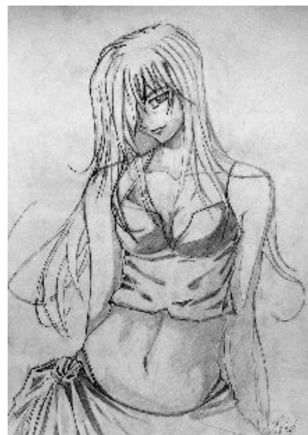
Lovász Gábor 12. B