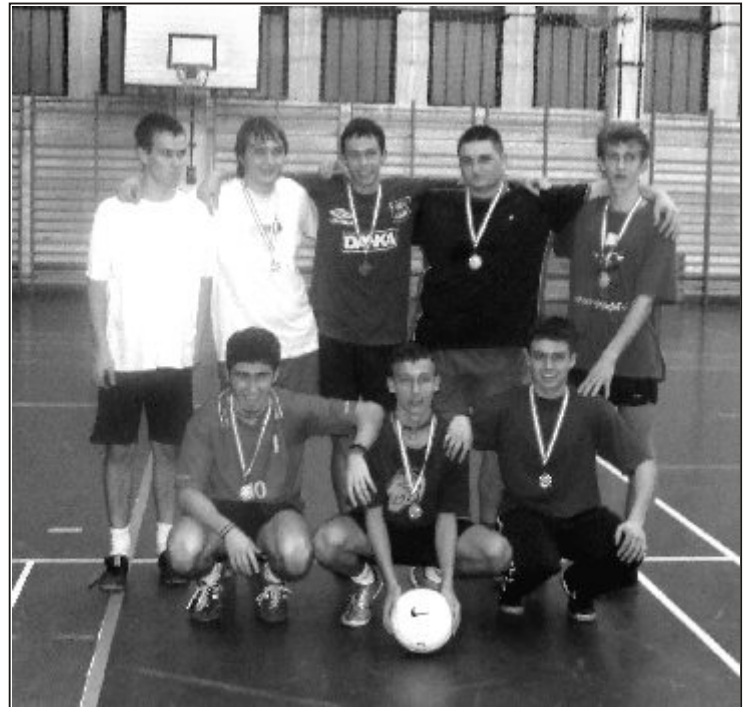
A 12. E osztály győztes csapata