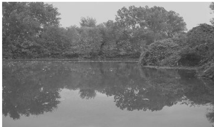
Cselovszki György 11. E