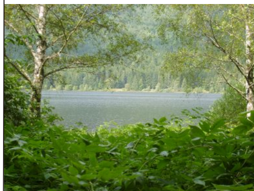
Révész Norbert 12. E